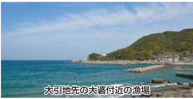
大引地先の大瀬付近の漁場

付近の地域にイセエビの漁獲量が増加するよう、約18m四方、高さ2mの「つきいそ」をつくり、漁場を整備するものです。