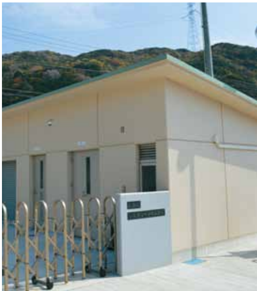
小引クリーンセンター

います。接続の推進については、戸別訪問をしたり、啓発用品の配布をしてきましたが、新たな推進の方法も模索していきたいと考えております。