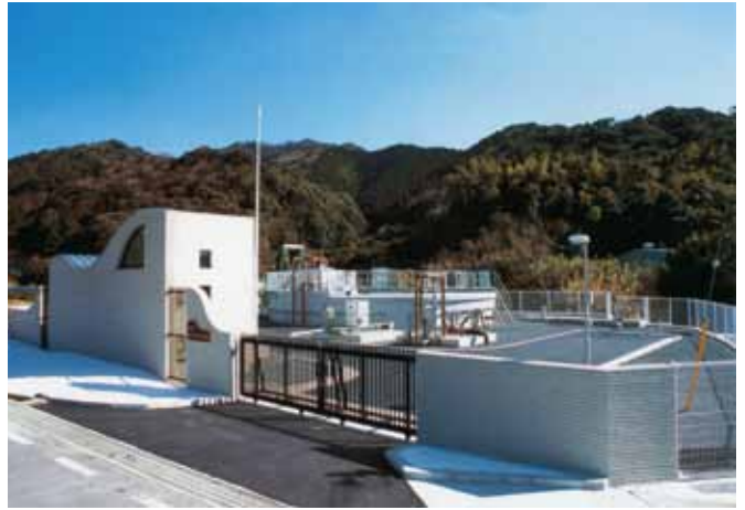
畑・中クリーンセンター

公共下水道事業 5億3400万円 平成30年度、畑・中クリーンセンターの撤去後、里区と門前区の供用開始は