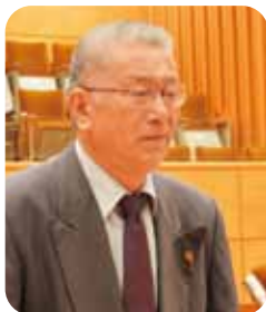
川出 純 議員

また、「まちづくり補助・助成事業」のパンフレットの全戸配布についてですが、内容は町のホームページ等に掲載していますし、公民館、地区館、役場窓口等に常備していますので、全戸配布は考えていません。