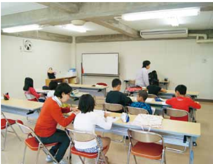
由良子ども未来塾

平成29年度から中央公民館で開設している由良子ども未来塾は、10名程度、白崎子ども未来塾は5、6名程度の参加者があります。