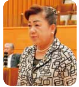
森 三枝子 議員