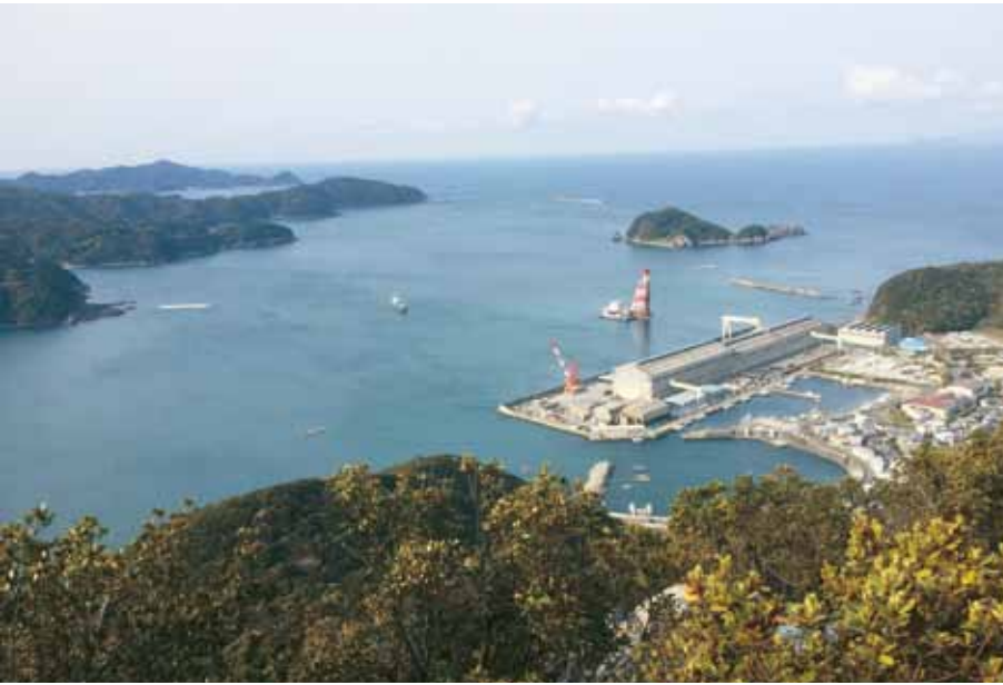
重山から見た由良港湾