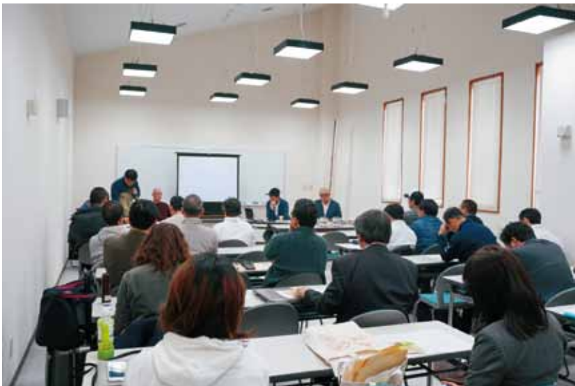
外部専門家を招いての研修会

思いがちながる観光地域づくり推進事業として、観光地域づくりに取り組む個人、団体での勉強会や意見交換会等の実施、地域の合意形成を行う勉強会や研修会、ワークショップ等の開催、地域おこし協力隊活動支援、白崎海洋公園の復興計画策定プロジェクトへの提言などの活動をして