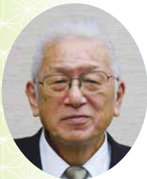
川出 純 議員