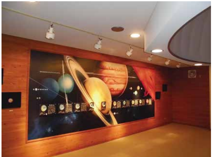
プラネタリウム「比良げんき村」