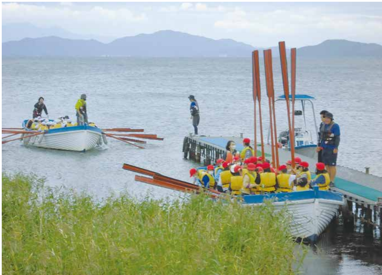
大自然の中での体験「びわ湖青少年の家」