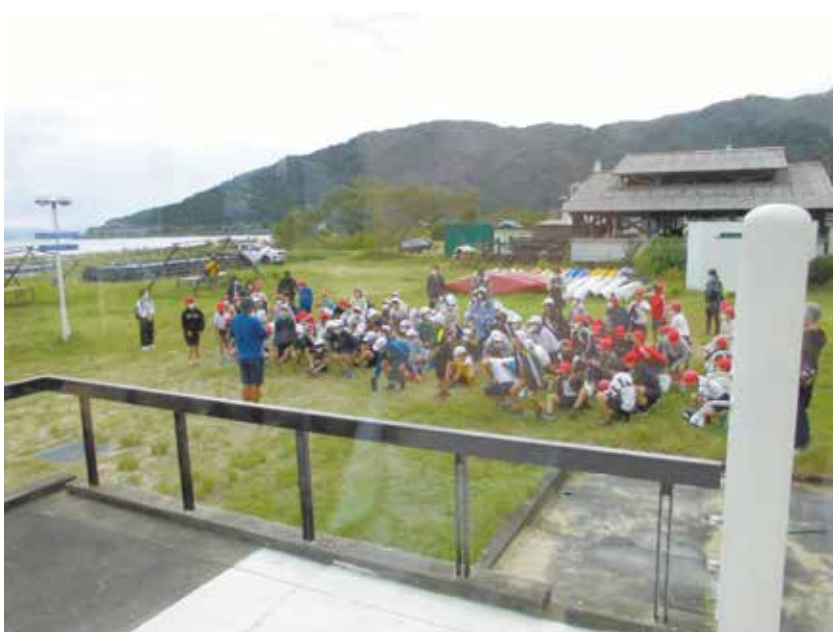
小学生による体験学習「びわ湖青少年の家」

10月5日に、議員9名、町職員2名は令和5年度から5年間白崎海洋公園「びわ湖青少年の家」を指定管理する㈱リンクワークスが運営管理している類似施設の運営状況や管理体制について行政視察を行いました。 最初に滋賀県高島市の同社直営施設で元大阪府アイヤー等と都会の子ど が不採算施設として売却し、購入後8年目になる「びわ湖青少年の家」を訪ねました。 びわ湖湖畔に建てられた大きな施設で、カヌー体験（インスタトラクター同行）、イカダ造り、バ