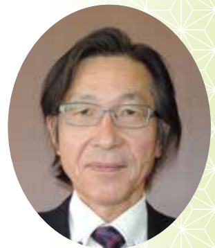
中谷 茂生 議員