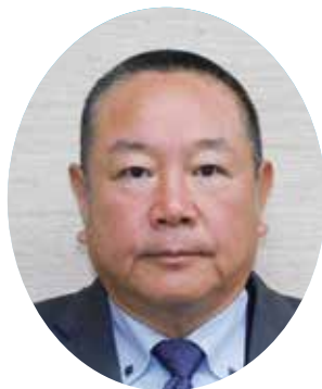
玉置 一郎 議員