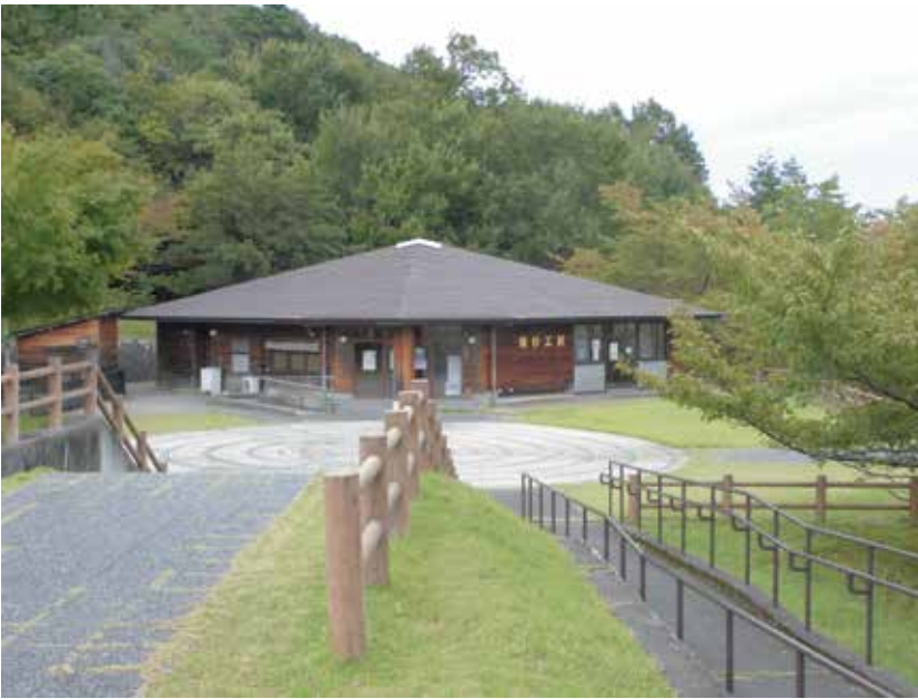
木工体験施設「比良げんき村」

次に訪問しました大津市「比良げんき村」は比良山系の裾野にあり、令和3年度から指定管理を受託しています。施設はたいへん広く、各種施設もあり、宿泊して楽しむ施設になっています。低料金であり、子ども