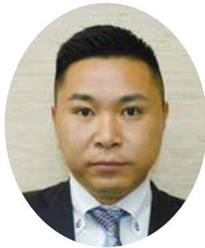
山本 大 議員