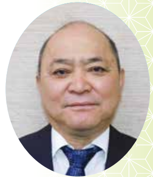
三上 幸夫 議員