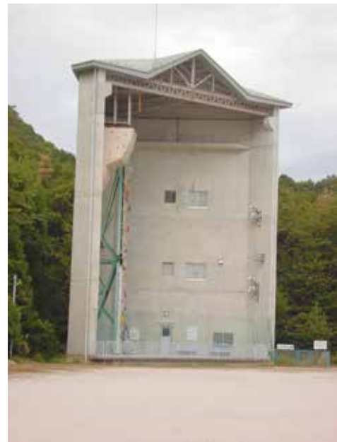
ボルダリング施設「比良げんき村」

主な施設は、宿泊棟、キャンプ場、プラネタリウム、星空観測棟、木工体験棟、アスレチック施設、グラウンド、ボルダリング等があり、施設全体の維持管理が適正にされていると感じ取れました。管理運営に工夫が感じられ、由良町議会が令和4年9月12日に指定管理について、全会一致で議決してよかったと再確認することができた視察となりました。