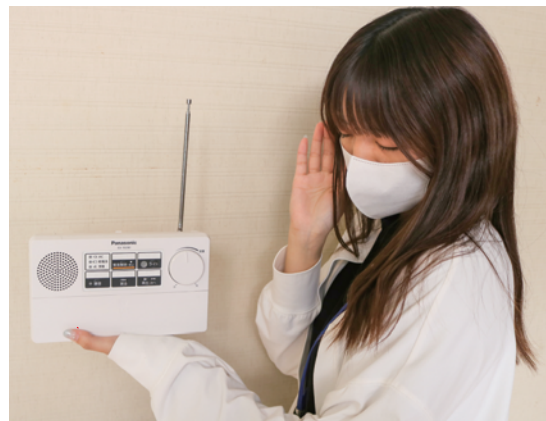
受信機の貸出しについては総務政策課へ

答 【総務政策課副課長】令和3年度から、防災行政無線の内容を受信できる機器を、申請された各家庭に設置する事業が始まり、令和3年度は117台、令和4年度は38台設置しています。今年度は、9月時点で2台設置している状況です。