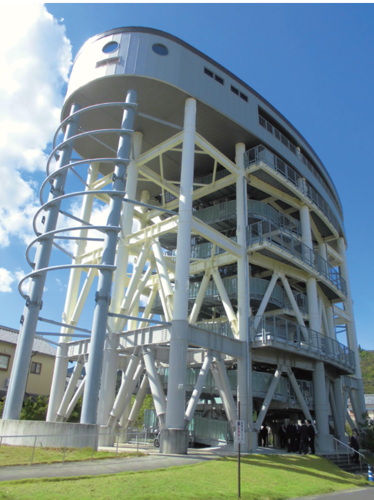
【黒潮町】佐賀地区津波避難タワー