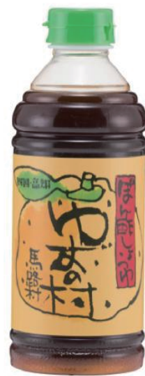
ゆずポン酢しょうゆ

産建厚生常任委員会において、「ゆず」で村おこしをしている世帯数約400世帯、人口約800人の高知県馬路村を行政視察しました。