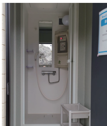
シャワールーム内