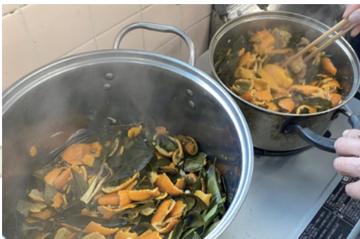
由良みかんの皮や枝葉で染料を抽出