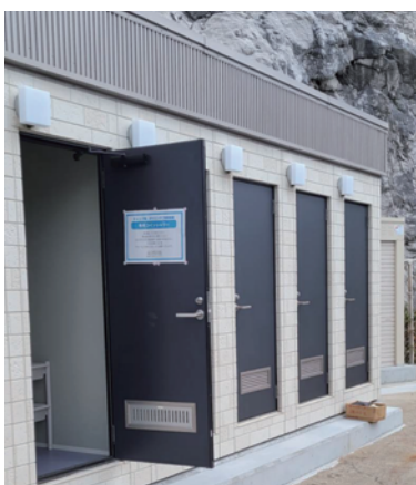
シャワールーム外観

【副町長】キャンプ場には、必要な施設だと思います。今後、利用頻度も高まり、白崎に来られたら汗を流してゆっくり帰っていただく意味のある事業だと思います。