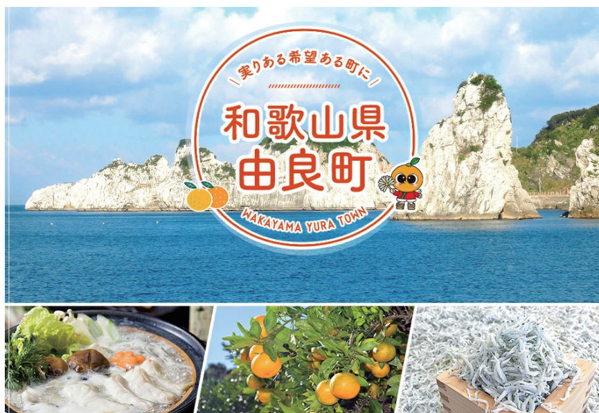
由良町ふるさと納税の取り扱いサイトより

新たな制度運用について、他の自治体や納税者の動向を注視しながら、寄附を増やす取り組みを継続していきたい。