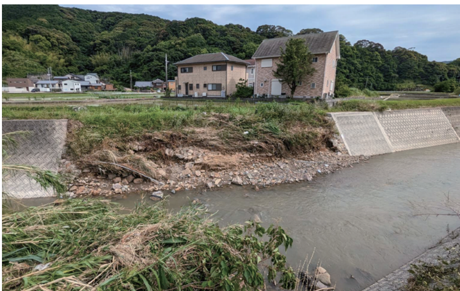
由良川の被災箇所（門前地区）

町としても、浸水被害に遭われた方が非常にご苦労をされているということも承知をしていますので、今後も県と被害状況を共有し、被害を少しでも軽減するなどの対策があれば、実施をしていただけるよう要望していきたい。