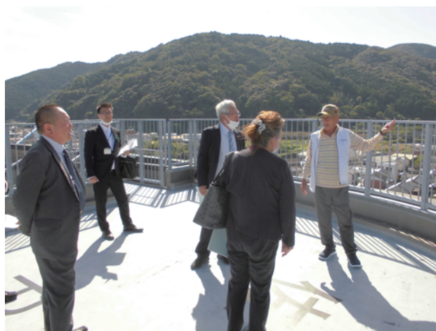
津波避難タワー屋上

総務文教常任委員会は、今後30年以内に70%～80%の確率で大規模地震が発生するといわれ、全国最大34.4mの津波が押し寄せると想定されている町・黒潮町で行政視察を行いました。高知県内の沿岸自治体は、津波避難対策を急ピッチで進め、黒潮町佐賀地区には、国内最大級(全体の高さ25m、想定浸水深18m、避難フロアの高さ22m、収容人数230名)の津波避難タワーが建造され、地区の生きる希望との願いも込め「命の塔」とも呼ばれ、年に何度も避難訓練を行って住民に親しまれています。