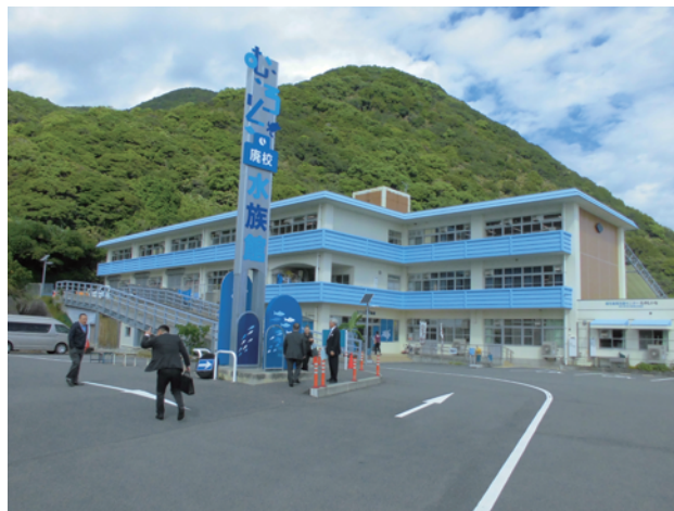
【室戸市】むろと廃校水族館