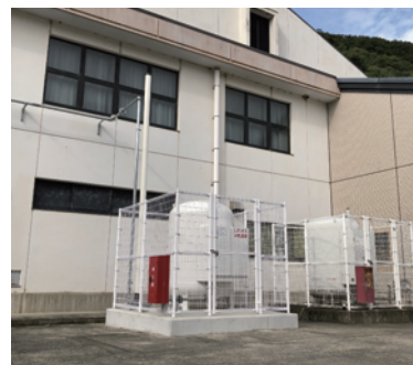
体育館クーラー設置