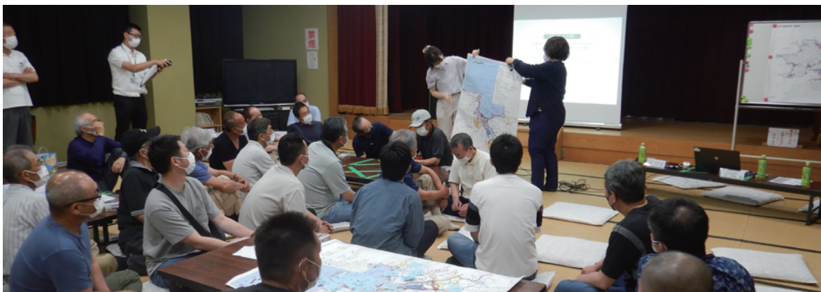
復興計画作成ワークショップ（衣奈）

【総務政策課副課長】京都大学の先生と生徒さん、広島大学の教授、摂南大学の教授の方々が、それぞれ担当される区に入っていただき、区長や区民の皆さんに計画図を説明し、意見交換やワークショップを行いました。また昨年度、網代区民に説明された報告や計画図などを中央公民館で展示しました。