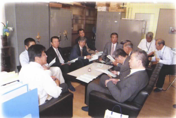
「施設面では要望はないですか?」 「良くなりました。」