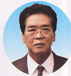
中村 森 議員

明けまして、おめでとうございます。初当選させていただきました。ありがとうございます。昨年は、あまり明るいニュースがありませんでしたが、今年は皆様にとつて、笑顔が沢山出せそうです。努力致しますと共に、女性の視点で、安全、安心の町づくりに全力をつくします。