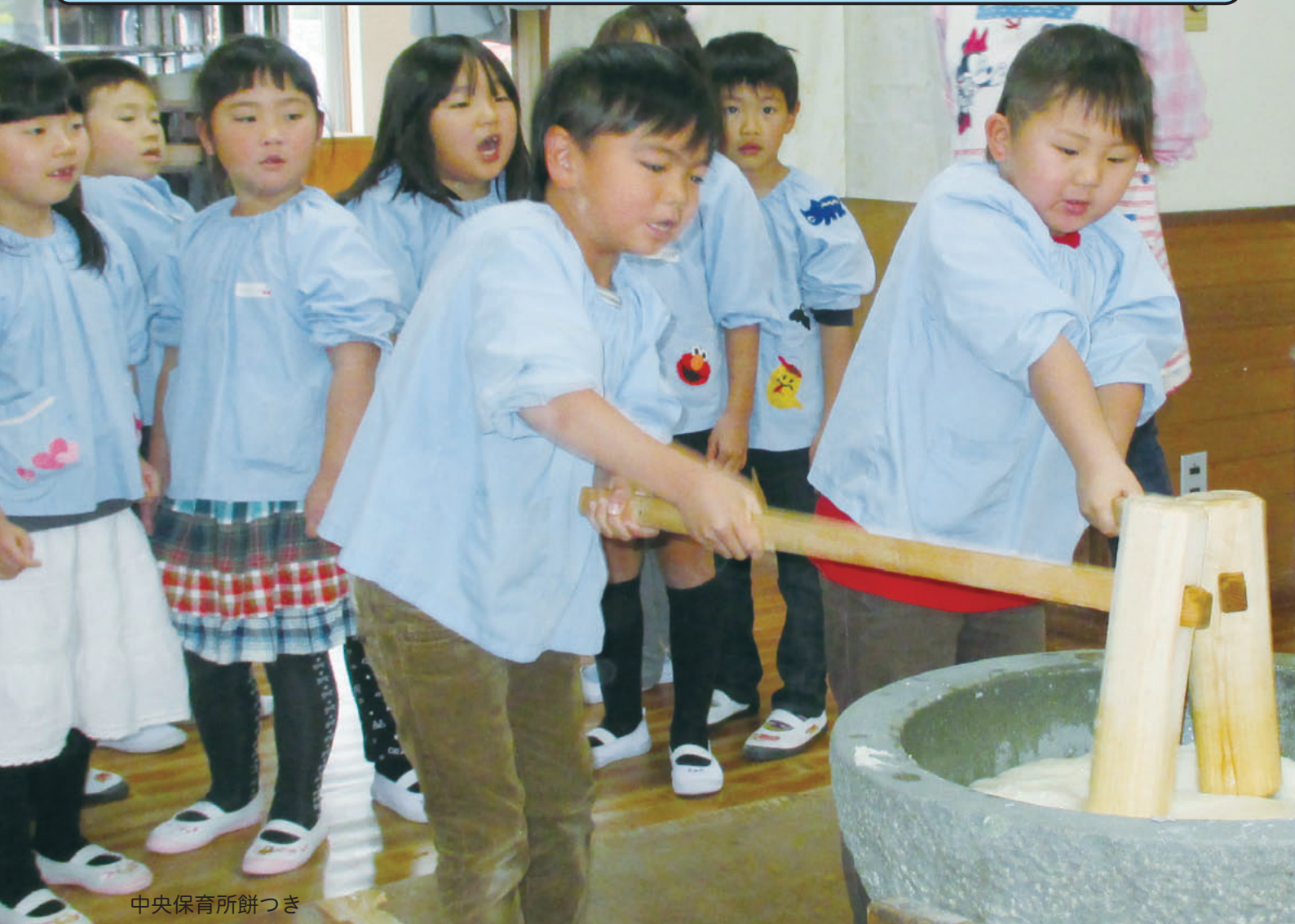
中央保育所餅つき

●由良町の人口と世帯( )前月比 人口6,445(-8) 男3,126(-2) 女3,319(-6) 世帯数2,597(3) (平成25年11月末現在)