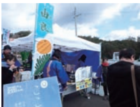
わかめとぼんかんをPR

2月11日にみなべ町の岩代大梅林に行ってきたよ♪由良町産品販売協議会のみんなと一緒にわかめとぼんかんをPR。ゆるキャライベントでは、ジェスチャーゲームで盛り上がったよ！この日は、雪がすごく寒かったんだけど、たくさんの人に喜んでもらえてうれしかったよ♪