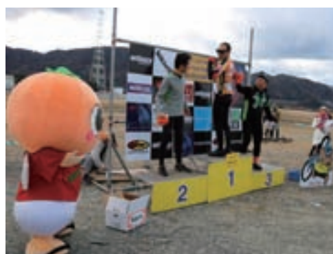
みんなすごくかっこよかったなあ♪