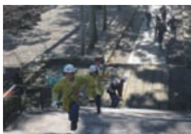
階段を駆け上がる消防団員

「文化財防火デー」(毎年1月26日)に伴い1月26日(木)に興国寺において、日高広域消防事務組合、由良町消防団及び興国寺自衛消防団による総合消防演習を実施しました。法堂(本堂)から出火したという想定で放水を行い水源からの消火の手順を確認しました。