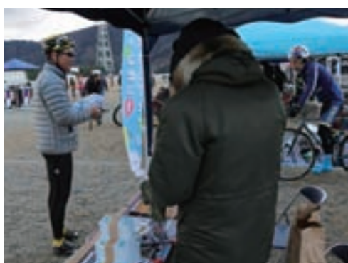
イベントPR頑張ったよ！！

2月12日は、マリーナシティで行われた自転車イベントに参加して、由良町のPRと4月23日に開催される、オーシャンビューサイクルフェスタ 白崎エンデューロ in 由良のイベントPRをしてきたよ♪シクロクロスは言わば自転車の障害物競走！マリーナシティの中を自転車で走ってるのを見てすごく興奮したよ♪天気も良くて、僕ともいっぱい遊んでくれたし本当に充実した1日だったなあ♪