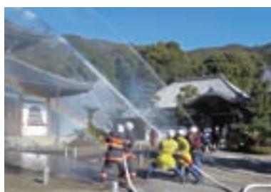
法堂に向けて一斉放水