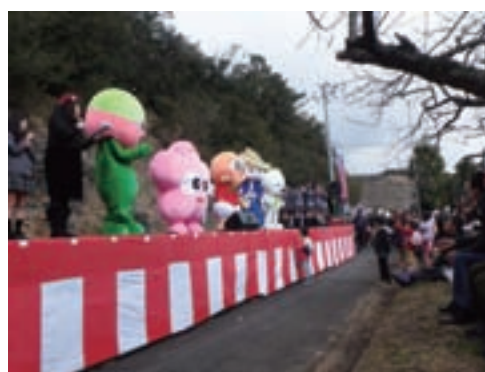
ステージイベントを盛り上げたよ！