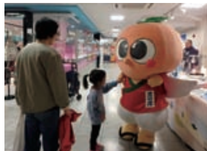
お友達もいっぱいできたよー

ゆらの助の日々の活動などをFacebookで随時更新中！ぜひチェックしてね♪ ゆらの助 Facebook ページURL