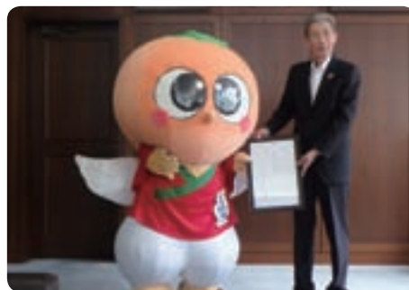
わくわくするなあ～♪

ゆらの助の日々の活動などを Facebook で随時更新中！ぜひチェックしてね♪ ゆらの助 Facebook ページURL www.facebook.com/yuranosuke.30383