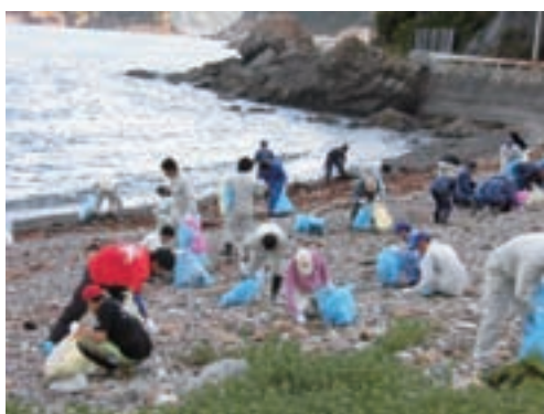
小引田子の浜海岸

瀬戸内・海の路ネットワーク推進協議会の骨格事業として、参加者をはじめとする多くの方々に「美しい瀬戸内を守っていく」ということを訴えていくことを目的に、平成5年から取り組んでいる活動です。