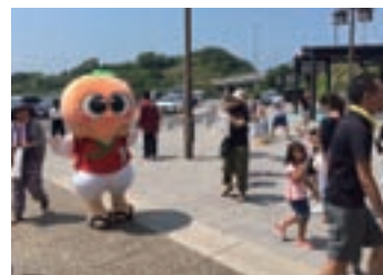
暑かったけどPR頑張ったよ♪

白浜の花火大会も同じ日にあったから、お客さんがものすごく多かったんだ！特産品が当たる抽選会もしたんだけど、あっという間に景品がなくなっちゃったよ！しっかりと観光のPRも出来たし、僕のファンもいっぱい増えてとっても楽しい2日間だったなあ～♪