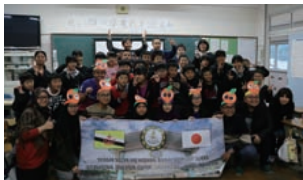
由良小学校児童と記念撮影