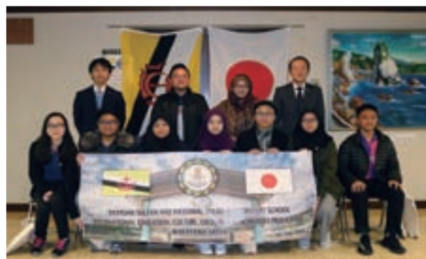
宮下副町長と記念撮影