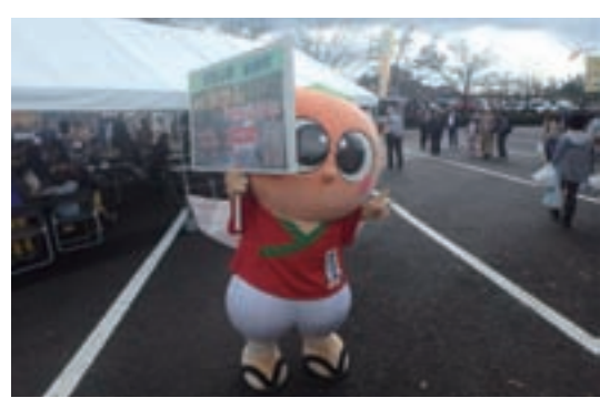
僕も一生懸命お手伝い！

もちろん由良町の特産品販売のお手伝いもちょうとしたよ！ おかげで最後はクタクタになったよ…。でも、また参加したいな！