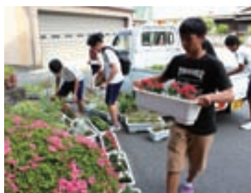
フラワーリンク活動の様子