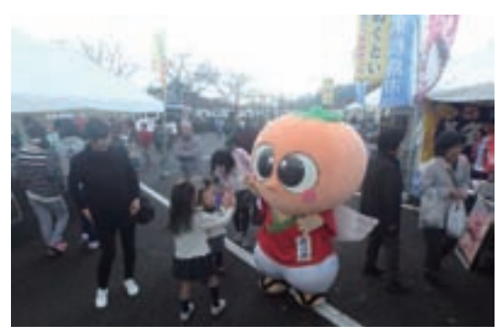
岐阜でも僕の人気はうなぎ上り～♪

ゆらの助の日々の活動などを Facebook で随時更新中！ぜひチェックしてね♪