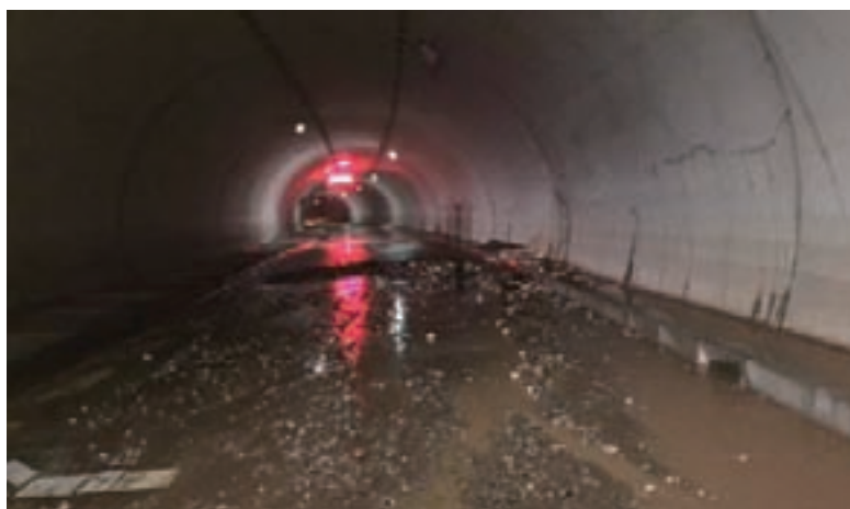
小引トンネル（台風 21 号被害）