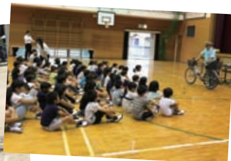
自転車の乗り方を教わる児童