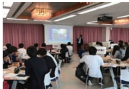
講義をしている様子