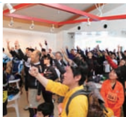
誰が産品を勝ち取るかな

ゆらの助の日々の活動などを Facebook で随時更新中！ぜひチェックしてね♪