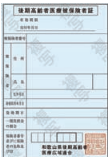
新しい被保険者証イメージ図

◆お手元に被保険者証が届き次第、医療機関で使用することができますので、医療機関窓口で提示してください。