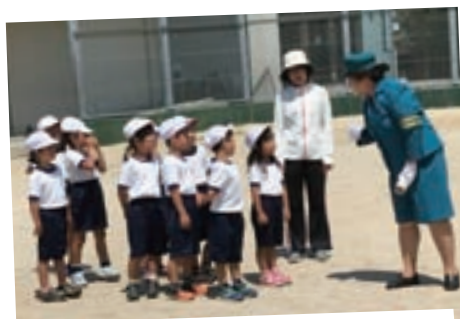
横断歩道の歩き方を教わる児童

由良町交通指導員会と由良駐在所による、交通安全教室が6月4日（月）に衣奈小学校、6日（水）に由良小学校、20日（水）に白崎小学校で行われ、児童に対して横断歩道の渡り方や自転車の正しい乗り方などの指導を行いました。