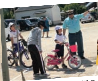
自転車マナーを教わる児童