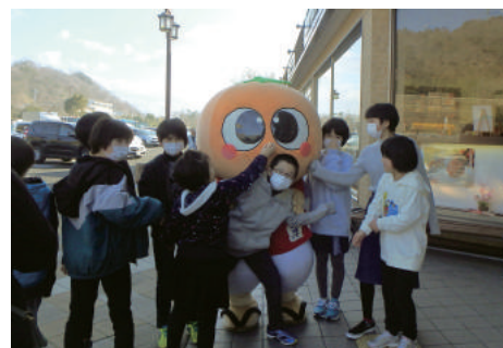
お母さんたちがアンケートしている間に