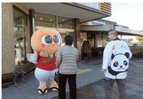
アンケートにご協力をおねがいします！

2月2日に紀ノ川サービスエリア（下り）で開催された日高広域観光振興協議会主催のPRイベントに参加してきたよ♪サービスエリアに立ち寄った人に由良町のことをパンフレットでPRしたんだ。他にもアンケート調査を行ったりもしたんだ。今回もいっぱい由良町のことをPRできたよ！