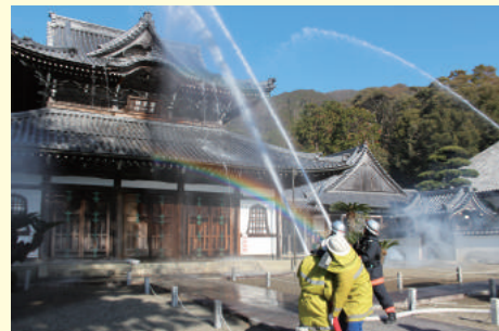
法堂(本堂)に向けて放水