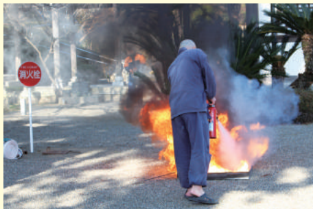
初期消火活動の様子

1月24日(木)に興国寺で、「文化財防火デー」に伴い、日高広域消防事務組合と由良町消防団、興国寺自衛消防団で総合消防演習を行いました。法堂(本堂)から出火したという想定で、初期消火活動や水源からの消火活動訓練を行いました。