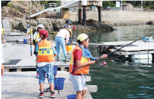
釣りを楽しむ子どもたち

子どもたちはアキアミ（アミエビ）で小アジを釣り、故郷の美しい海とすばらしい自然に触れていました。