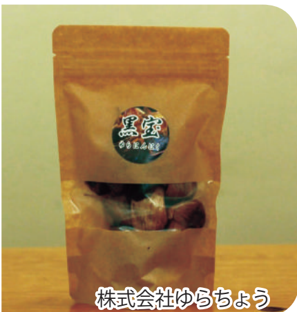
株式会社ゆらちよう