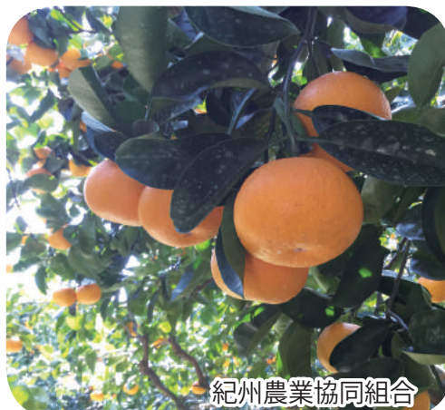
紀州農業協同組合