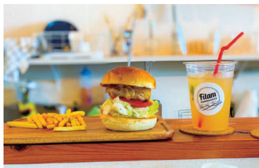
すごくおいしかったなあ～！

衣奈にハンバーガーが一押しメニューのカフェ、Fitam フィータム ができただよ！ ハンバーガーがすごくおいしくて、お店の雰囲気もおしゃれで居心地もすごくよかったよ！ 由良町のおすすめスポットが増えてうれしいな～♪ みんなもおっきなハンバーガーを食べて、すてきな時間を過ごそうね♪