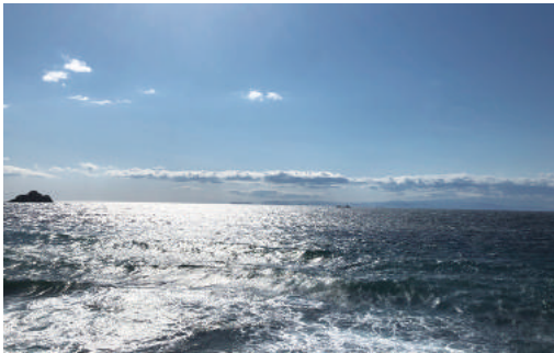
白崎海岸から臨む水平線