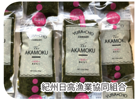
紀州日高漁業協同組合