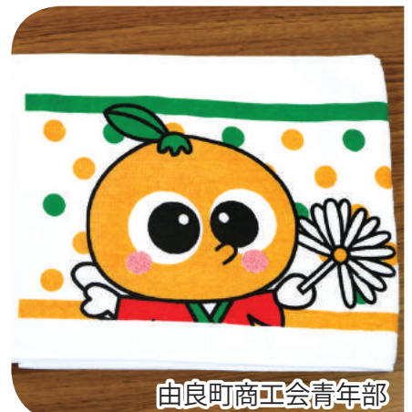
由良町商工会青年部