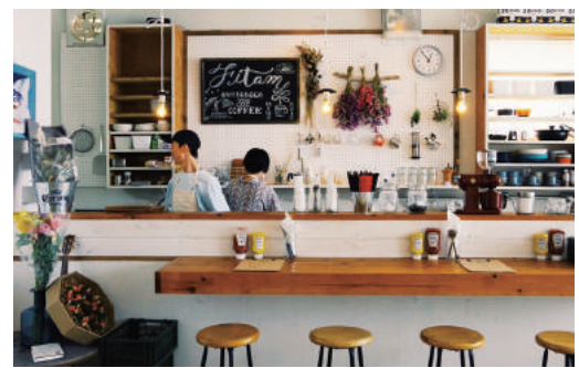
ゆっくりと過ごせそうだね♪

特定創業支援事業とは？ 創業希望者に対して町と商工会が創業のための専門知識を継続的に提供する事業です。 なお、支援をご希望される方は、産業建設課又は由良町商工会にご相談ください。