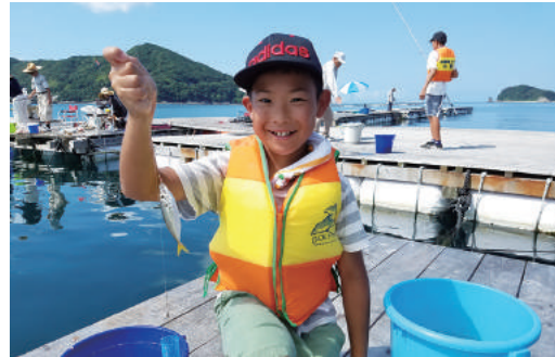
いっぱい釣れました