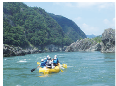
ラフティング体験