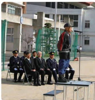
消防団長による挨拶