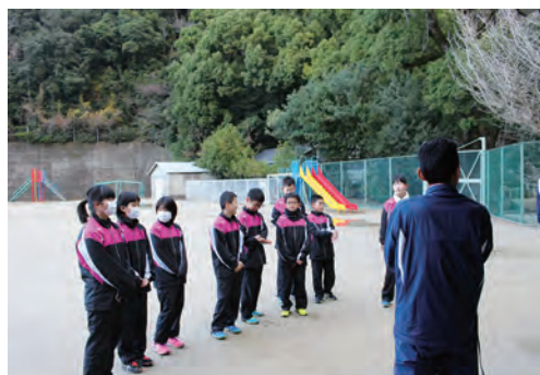
濱野監督によるミーティング