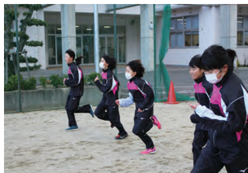
練習に励む選手たち