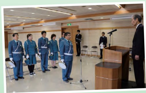
会長からの決意表明