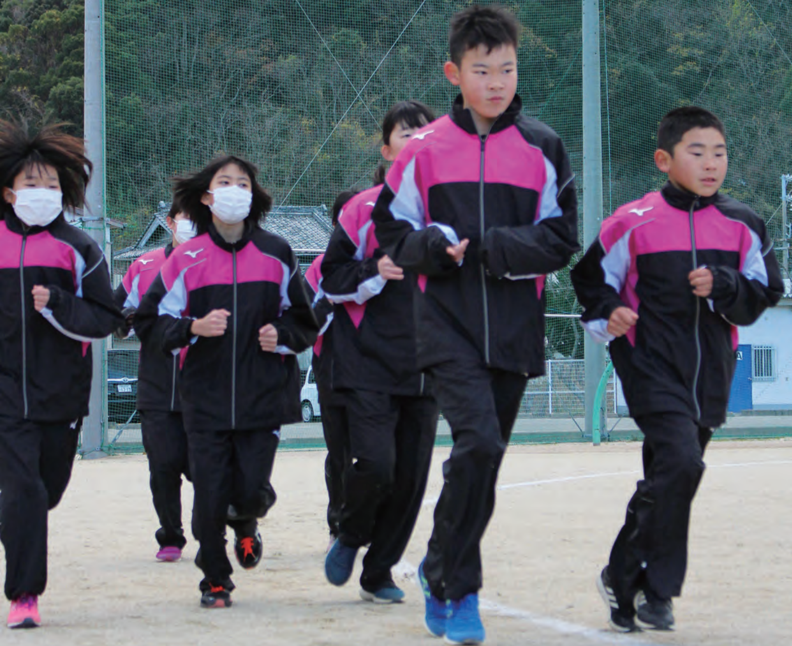
ジュニア駅伝競走大会に向けて練習に励む選手