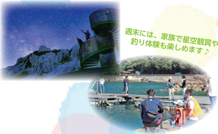
週末には、家族で星空観賞や釣り体験も楽しめます♪

※各補助事業には、住所要件などの要件があります。制度の詳細な内容については、直接お問い合わせください。