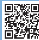
由良町まちづくり補助・助成事業パンフレット

●特集に関するお問い合わせ 産業振興課 TEL：65-3850 Mail：sangyou@town.yura.lg.jp