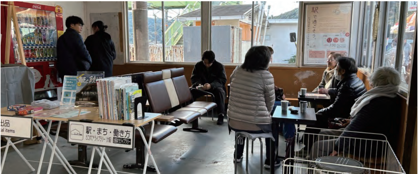
JR 紀伊由良駅、駅中イベント

今後どのように由良駅と周辺の町づくりを進めたいのか。 また工程ができてきているのか。