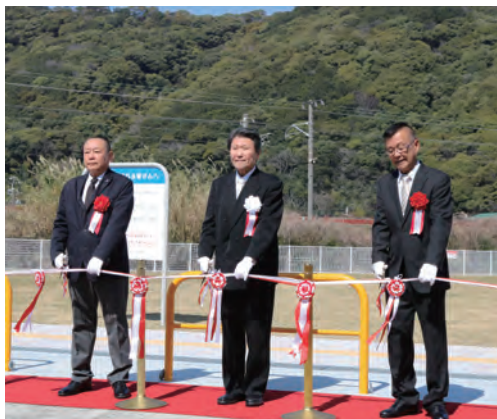
由良町中央公園テープカット