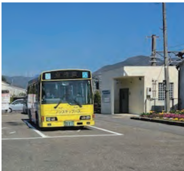
駅前バス（JR 紀伊由良駅）

分離の安全なロータリー整備に伴う一時的な駅前広場の機能移転などの活用を想定しており、JR西日本をはじめ交通事業者とも協議を進めながら、段階的に一步步つ前向きに取り組んでいきます。