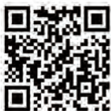
地震警報で安全な運動場から教室に戻る生徒

今後、示していただいた例を参考にしながら、避難の基本及び応用のあり方について知見を深め、訓練の質を高めていきたいと考えております。