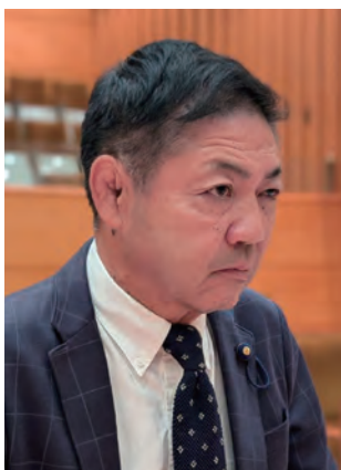
いわさき たけし 岩崎 武司 議員

その上で、2023年度から休日の部活動を地域スポーツクラブなどに委ねる地域移行を段階的に開始し、2025年度までを改革集中期間と位置づけて移行を進め、将来的には平日の指導についても地域に委ねることを目指すとしています。